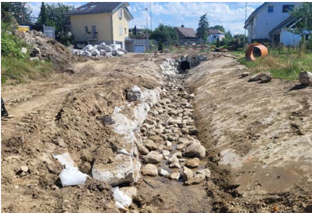
5. Création du lit du ruisseau. Le fond du lit est étanchéifié au moyen d'une natte de bentonite