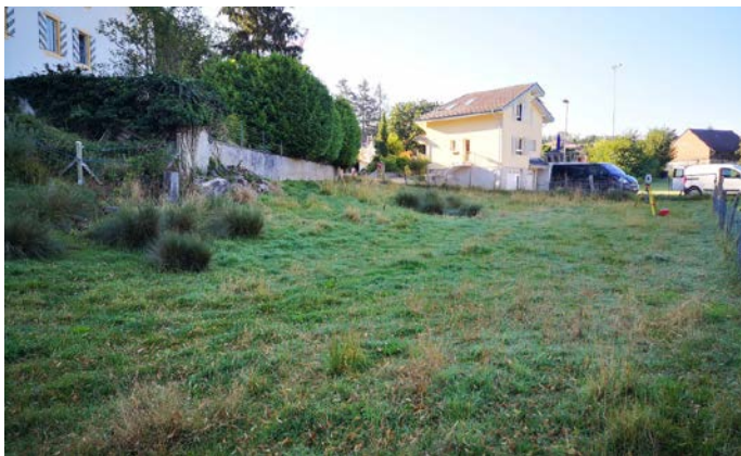
En amont du cordon boisé, le champ sous lequel coule le ruisseau, Illex 2020

Une plus-value paysagère est créée en végétalisant les berges du ruisseau, en continuité avec le cordon boisé déjà existant et renforce ainsi le réseau de corridors écologiques, les surfaces d'habitats pour la faune et la flore, tout en ombrageant le cours d'eau.