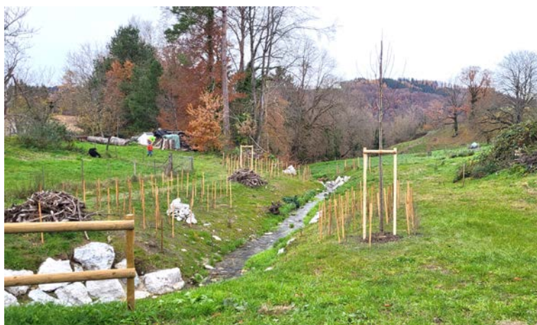
Le Champ Christin après travaux, Ilex 2023