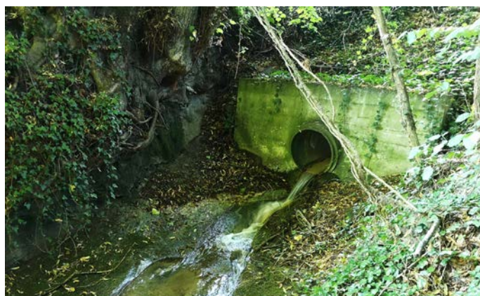
La sortie du collecteur sous-dimensionné, situé en aval, dans le cordon-boisé, Illex 2020