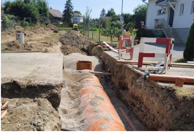
1. Pose du nouveau collecteur d'un diamètre de 1200mm. (L'ancien diamètre était de 600mm)