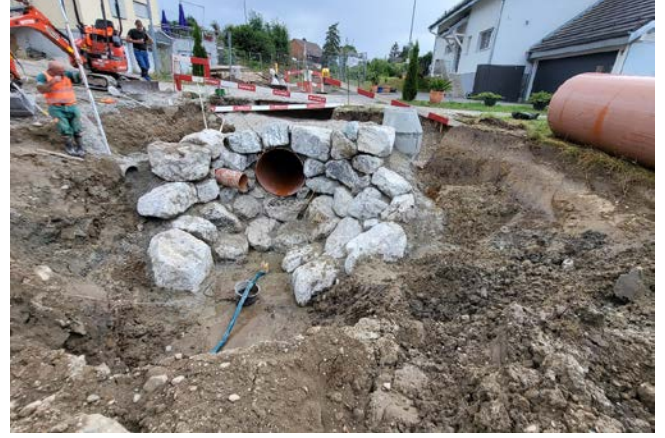
2. Création de l'enrochement et de la fosse de dissipation (une 2 ème fosse a également été creusée en aval de la rampe-cascade)