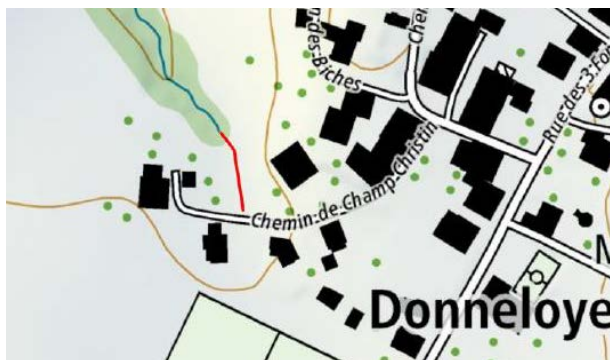
Situation du tronçon remis à ciel ouvert, extrait du guichet cartographie du Canton de Vaud

Dans ce cadre, la commune de Donneloye a souhaité la remise à ciel ouvert d'un tronçon du Ruisseau du Champ des Pierres, ainsi que le remplacement du collecteur sous dimensionné entrainant des inondations dans un quartier d'habitations.