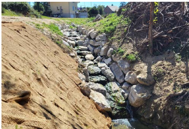
7. Pose de fibre de coco pour la stabilisation des berges en attendant la végétalisation