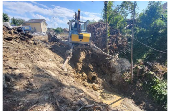
6. Création de la rampe-cascade afin de rattraper le dénivelé important (30%) jusqu'au cordon boisé.