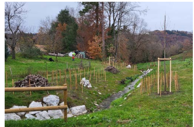
8. Plantation de buissons et de plantes hélrophytes sur les berges